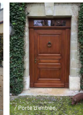
/ Porte d'entrée.