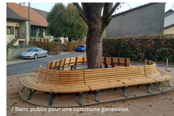
/ Banc public pour une commune genevoise.